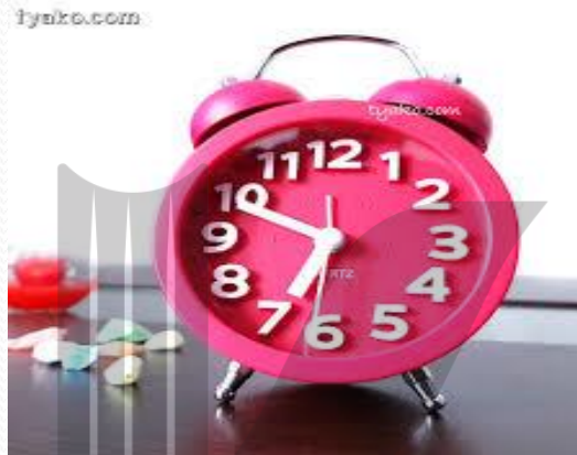
اجزای یک ساعت