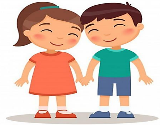
فرزندان یک پدر و مادر با یکدیگر