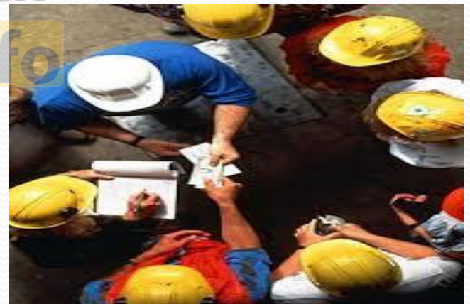
کارگر و کارفرما