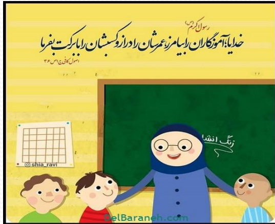
استاد و شاگرد