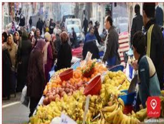
داد و ستد