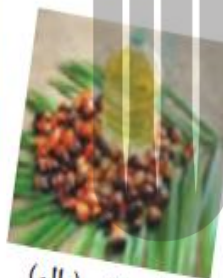
نخل روغنی (پالم)