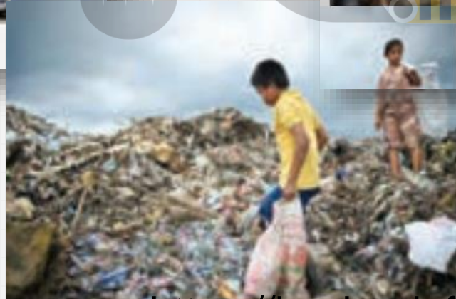
استفاده از کار کودکان در جمع آوری زباله - فیلیپین