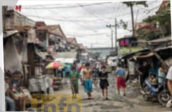
بیش از چهار میلیون نفر از مردم فیلیپین در زاغه‌ها زندگی می‌کنند.