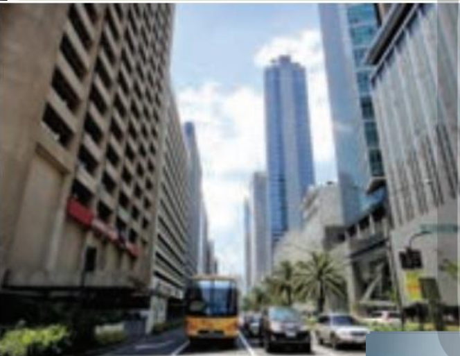
خیابانی در مانیل پایتخت فیلیپین

سیاست ها و تصمیماتی که حکومت یک کشور در زمینه اقتصاد، اشتغال و توزیع در آمد اتخاذ می کند و همچنین نوع برنامه ریزی و بودجه ای که به نواحی مختلف کشور (شهر، روستا، استان و ...) اختصاص می دهد، بر توزیع امکانات و تجهیزات در نواحی مختلف اثر می گذارد. در نتیجه، ممکن است توزیع امکانات مناسب و عادلانه یا به دور از عدالت باشد و چشم اندازهها و فضاهای جغرافیایی متفاوتی ایجاد شود.