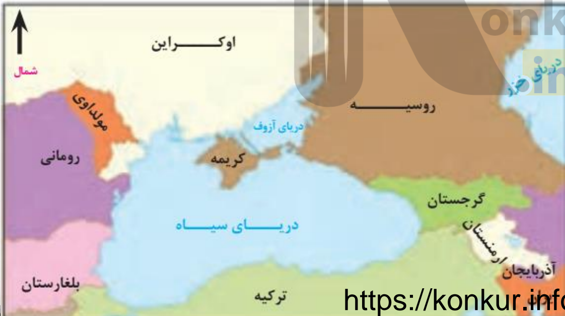
موقعیت جغرافیایی شبه جزیره کریمه

امروزه این شبه جزیره به موضوع کشمکش بین اوکراین و روسیه با مداخله امریکا و دولت های غربی عضو پیمان ناتو تبدیل شده است.