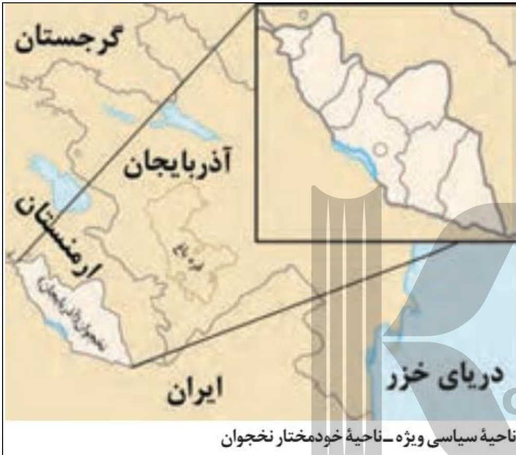
ناحیه سیاسی ویژه - ناحیه خودمختار نخجوان

به عبارت دیگر، خودمختاری، استقلال محدود یک واحد سیاسی در اداره امور خود در داخل یک کشور است.