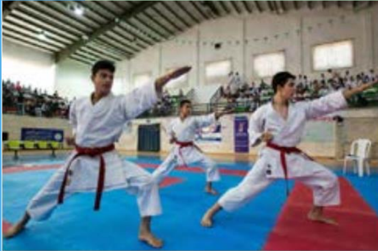
ورزش کاراته - ایران

به تصاویر توجه کنید؛ در هر تصویر چه پدیده ای را مشاهده می کنید؟ به نظر شما خاستگاه این پدیده ها کجاست و چگونه به این ناحیه هامنتقل شده اند؟