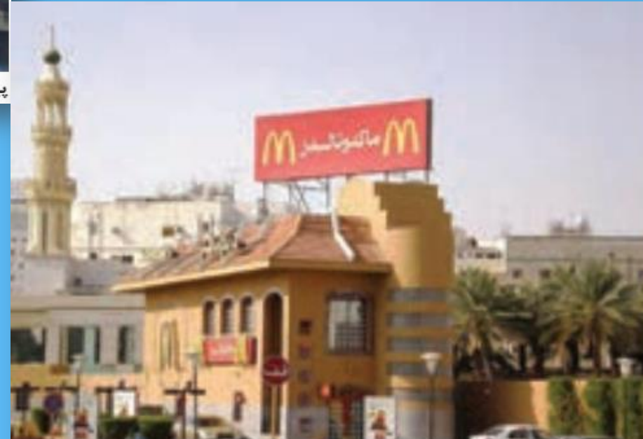
شعبه یک فست فود امریکایی - عربستان