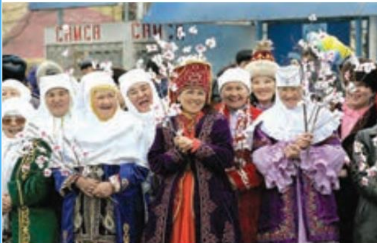
جشن نوروز - روستایی در قزاقستان