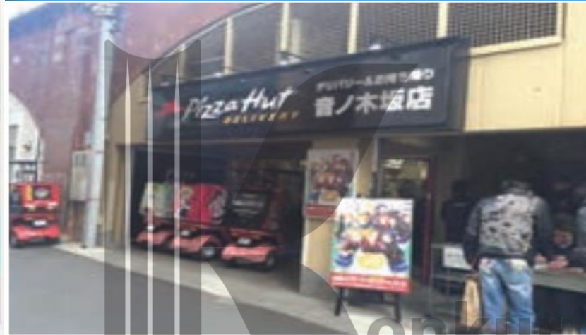
پیتزا فروشی - ژاپن