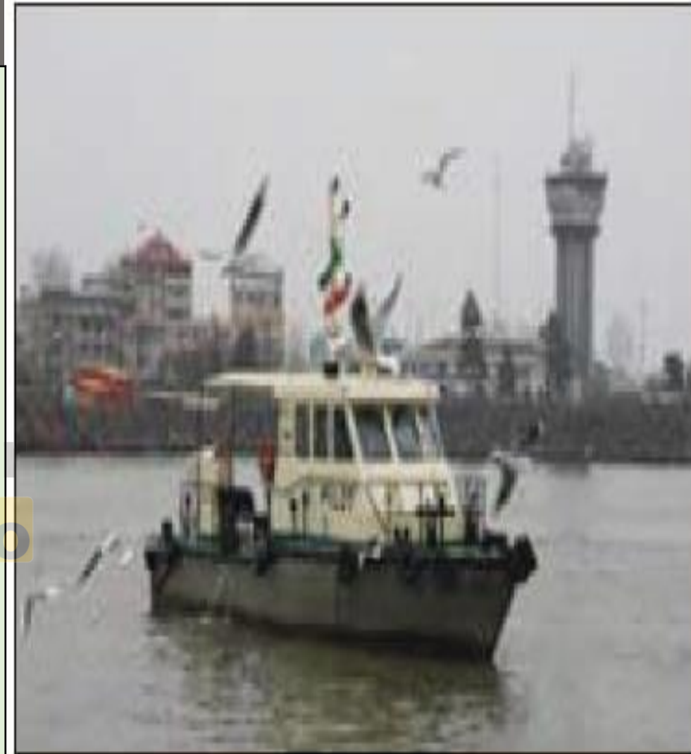
ساحل بندر انزلی - گیلان