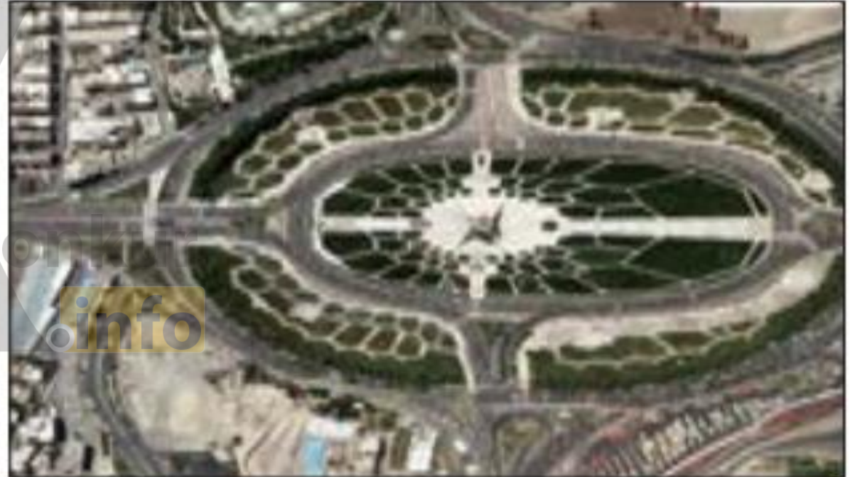
شکل ۳- میدان آزادی - تهران ۱۳۹۵