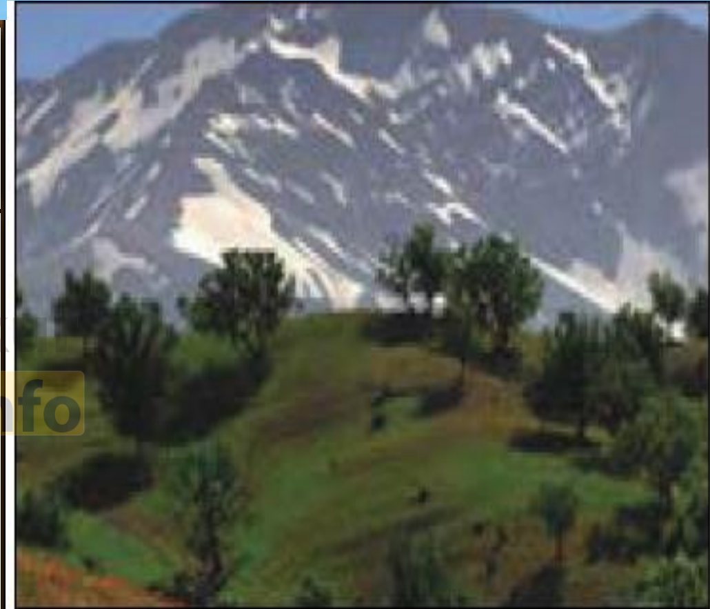
زردکوه - چهارمحال بختیاری