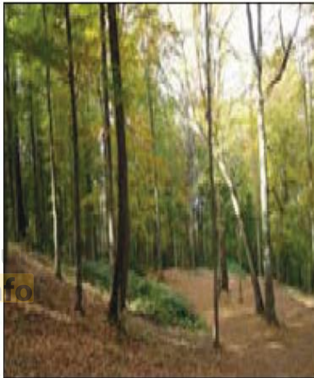
جنگل گلستان - استان گلستان