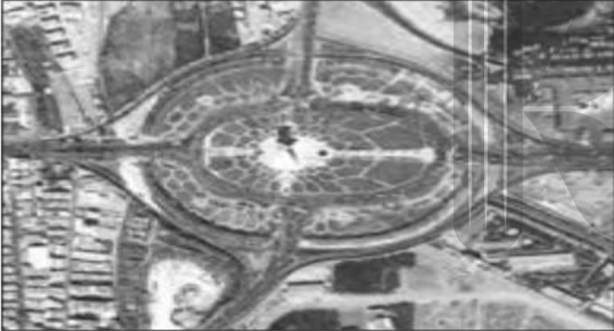
شکل ۴- میدان آزادی - تهران ۱۳۶۵

به تصاویر زیر دقت، و برداشت خود را از آنها با سایر همکلاسی های خود مطرح کنید، نظر آنان را جویا شوید و بایکدیگر مقایسه کنید.