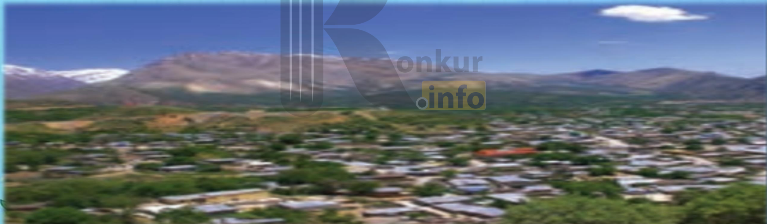
شکل ۹- شهر کوهپایه ای سی سخت - کهگیلویه و بویراحمد

(۴) با تهیه نقشه زمین شناسی، امکان زمین لرزه در شهر را بررسی می کند ( ژئومورفولوژی ).