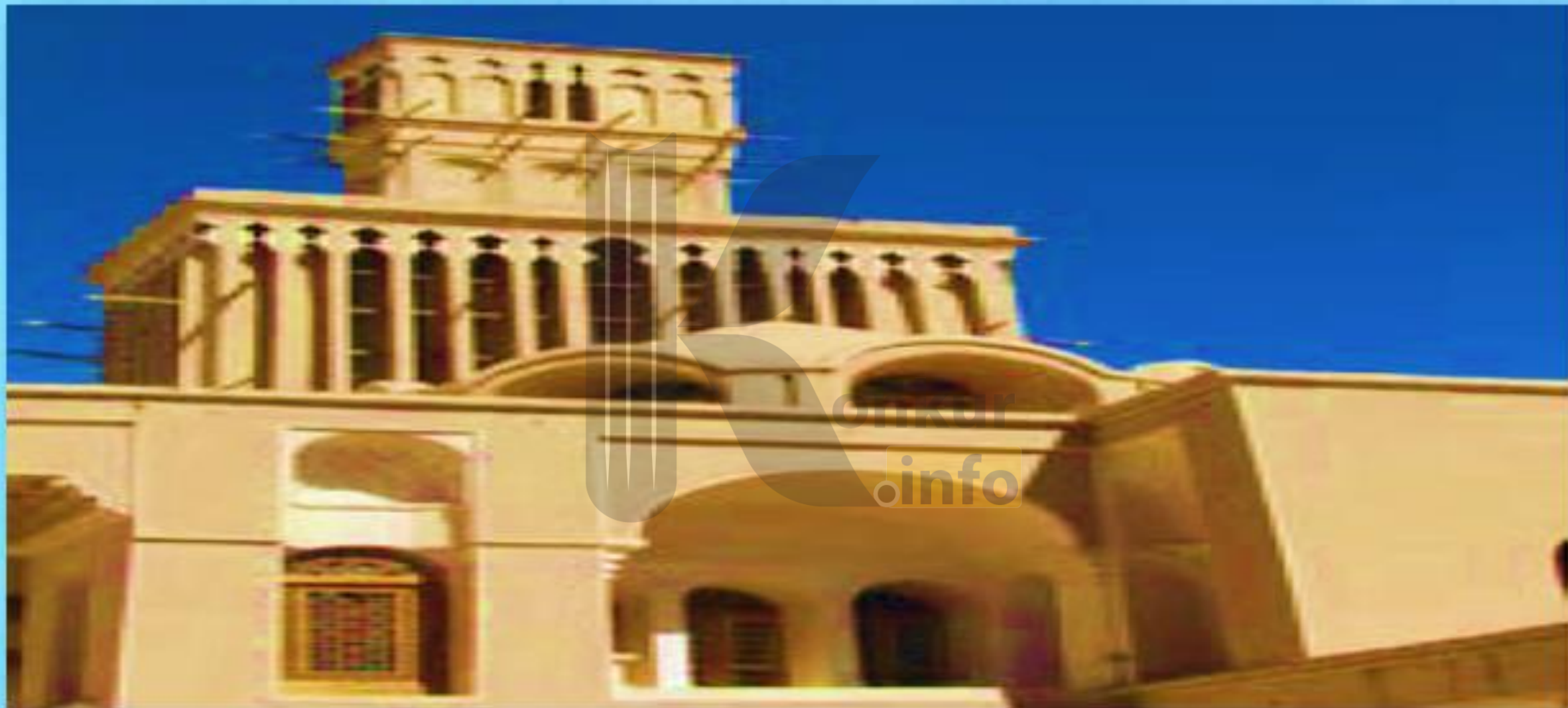
شکل ۵ - بادگیر دو طبقه ابرکوه - استان یزد