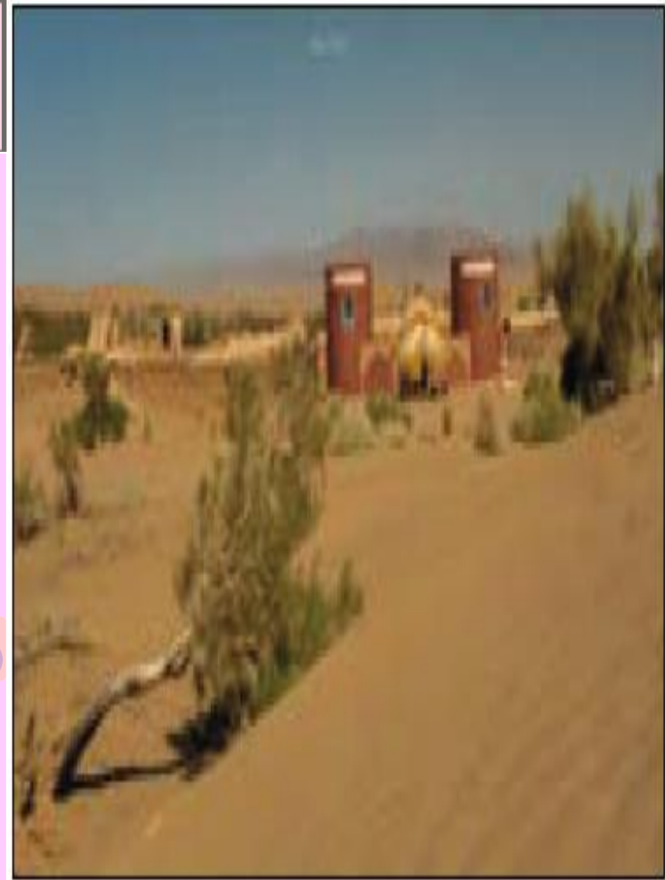
کویر مصر - اصفهان