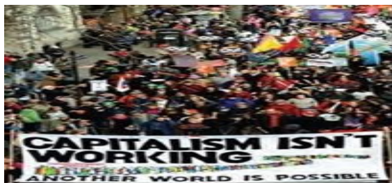
فقر و غنا، چالشی همیشگی در سرمایه داری غربی

ب) آسیب های مربوط به فقر و غنا همواره متوجه قشرهای فقیر و ضعیف جامعه است، ولی آسیب های مربوط به بحران اقتصادی تمامی جامعه را در بر می گیرد.