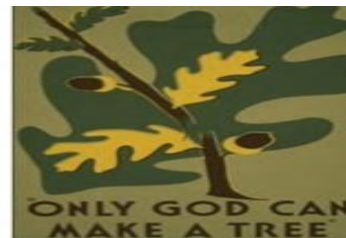
دو نگاه متفاوت به طبیعت

۲۵- نگاه فرهنگ توحیدی نسبت به طبیعت چگونه است؟