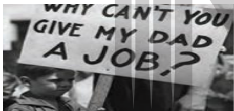
بحران اقتصادی غرب در سال های بین دو جنگ جهانی

ج) بحران اقتصادی سال های اخیر در اروپا و آمریکا از سال ۲۰۰۸ شروع شده است و با وجود تلاش هایی که برای مهار آن می شود، همچنان ادامه دارد.