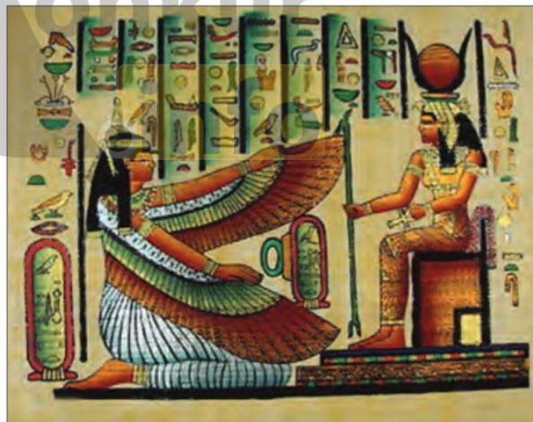
■ تصویر فرعون، نقاشی های دیواری مصر باستان