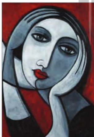
■ هنر قرون وسطی بر بعد معنوی وجود انسان تاکید داشت اما هنر مدرن به بعد جسمانی وجود انسان توجه دارد.