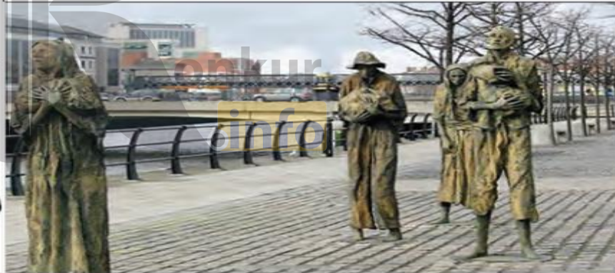
■ یادمان قربانیان قحطی بزرگ در دوبلین پایتخت ایرلند