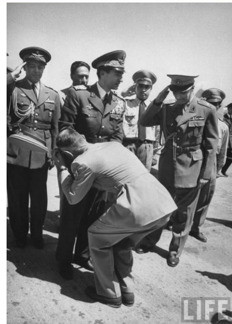
هنگام ترک محمدرضا از ایران