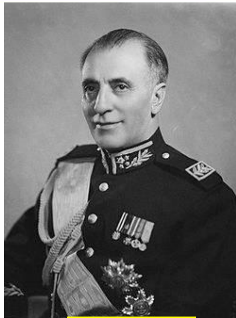
فضل الله زاهدی

مقامات آمریکا در مشاوره با همتایان انگلیسی خود، فضل الله زاهدی را به عنوان فرماندهی نظامی کودتا انتخاب کردند و شاه را متقاعد نمودند که زاهدی را بپذیرد و از کودتا حمایت کند.