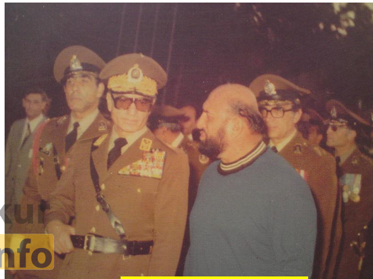
شعبان جعفری و رضا شاه

همزمان با این اقدامات عوامل نظامی کودتا مناطق حساس از جمله ستاد ارتش، ایستگاه رادیو، مراکز پلیس و ژاندارمری، مرکز تلفن و تلگراف و خانه دکتر مصدق و یارانش را تصرف کردند. زاهدی سوار بر تانک به نخست‌وزیری رفت و واحدهای انتظامی و نظامی طرفدار دکتر مصدق اقدام مؤثری علیه کودتا نکردند.