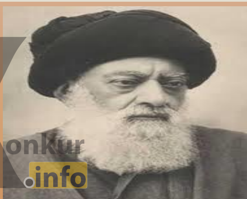
سید محمد طباطبایی