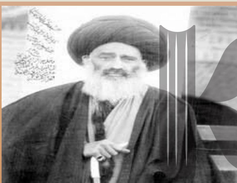
سید عبدالله بهبهانی

شخصیتهایی که بعد از به توپ بستن مجلس توسط قزاق ها دستگیر و شکنجه و تبعید شدند