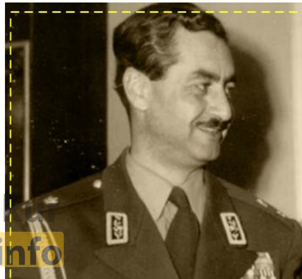
سرتیپ تیمور بختیار

تیمور بختیار که افسری بی رحم و خونریز بود، برای استقرار و تثبیت حکومت کودتا، سرکوب نیروهای ضدکودتا و میهن دوست را آغاز کرد.