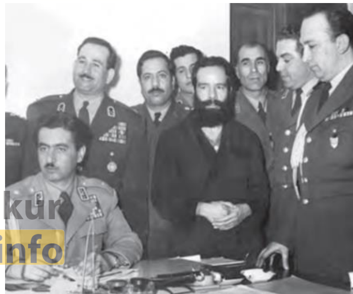
دستگیری دکتر فاطمی وزیر خارجه دکتر مصدق

عده بسیاری از مخالفان را دستگیر و زندانی کرد و عده‌ای از آن‌ها تبعید و تیرباران شدند. تظاهرات شهرستان‌ها و تهران با سرکوب شدید مواجه شد؛ فرمانداری نظامی، همچنین سقف بازار تهران را تخریب و جمعی از بازاریان را به جزیره خارک تبعید کرد.