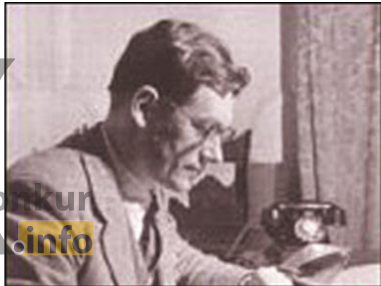
سر دنیس رایت

سر دنیس رایت کاردار انگلیس وارد تهران شد و دو دولت ایران و انگلیس طی اعلامیه‌ای برقراری روابط سیاسی را اعلام کردند. در پی آن آیت الله کاشانی با این اقدام دولت زاهدی مخالفت کرد.