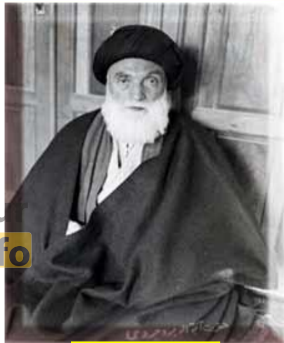
آیت الله بروجردی

با رحلت آیت الله بروجردی مرجع بزرگ تقلید شیعیان جهان در فروردین ماه ۱۳۴۰، محمد رضا شاه تصور کرد که زمینه برای جانشینی مرجع یا مراجع تقلید به جای آیت الله بروجردی وجود ندارد. از این رو فرصت را برای اجرای اصلاحات مورد نظر آمریکا مناسب دید.