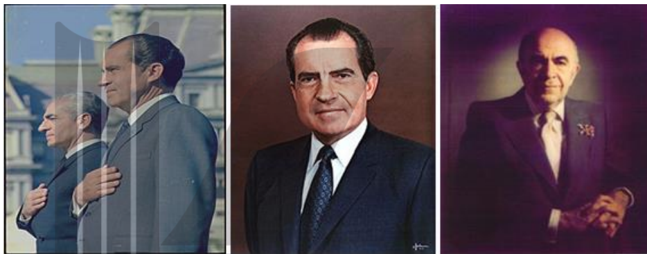
ریچارد نیکسون و محمدرضا پهلوی

❖ شاه همچنین با شوروی که رقیب و دشمن آمریکا بود، مناسبات سیاسی نسبتاً دوستانه‌ای داشت و به رغم سلطه آمریکا بر ایران، روابط حکومت پهلوی با شوروی سرد و خصومت‌آمیز نبود.