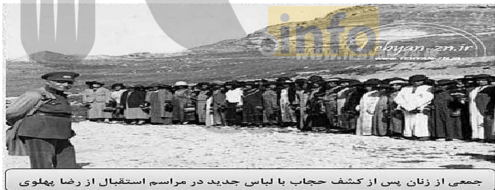
جمعی از زنان پس از کشف حجاب با لباس جدید در مراسم استقبال از رضا پهلوی