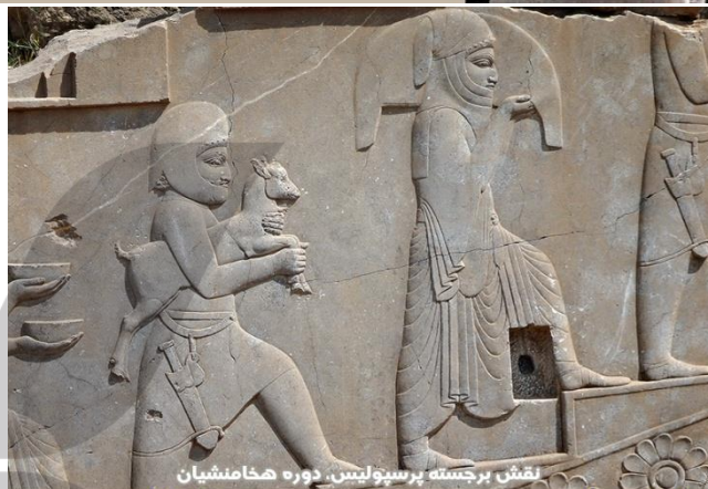
نقش برجسته پرسپولیس، دوره هخامنشیان تاریخچه حجاب: تصویر فوق نشان می دهد در دوره هخامنشیان، زنان ایرانی هنگام حضور در اجتماع، از روسری و لباس بلندتر نسبت به مردان استفاده می کردند.