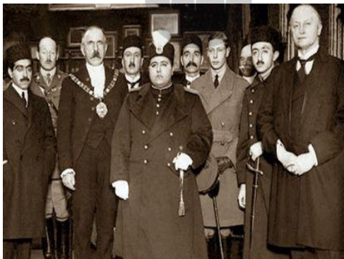
تصویر مربوط به زمان تاج گذاری احمدشاه