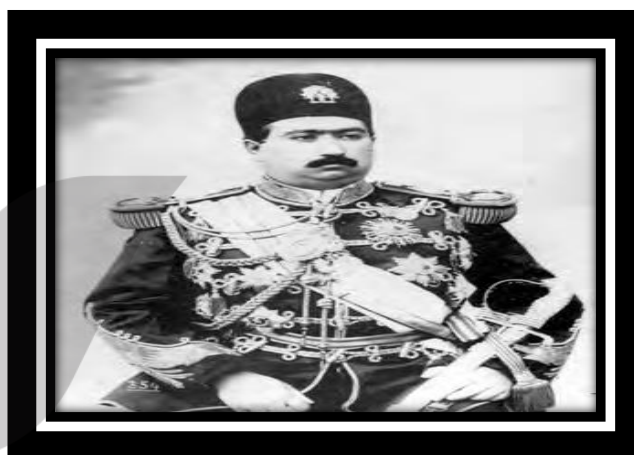
احمد میرزا (احمدشاه) قاجار (هفتمین و آخرین شاه قاجار)