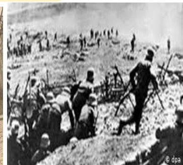
تصاویر مربوط به جنگ جهانی اول

شروع جنگ جهانی اول در سال ۱۲۹۳ ه.ش / ۱۹۱۴ م.