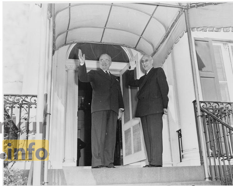
دیدار دکتر مصدق با هری ترومن

با گذشت زمان، سیاست دولت آمریکا نسبت به نهضت ملی شدن نفت و دولت دکتر مصدق از حمایت و میانجی‌گری به مداخله‌گری و همکاری با انگلستان برای براندازی تغییر یافت؛ زیرا از یک سو انگلیسی‌ها قول دادند، شرکت‌های نفتی آمریکایی را در منابع نفت ایران شریک سازند و از سوی دیگر خطر نفوذ کمونیسم و حزب توده را در ایران بزرگ جلوه دادند.