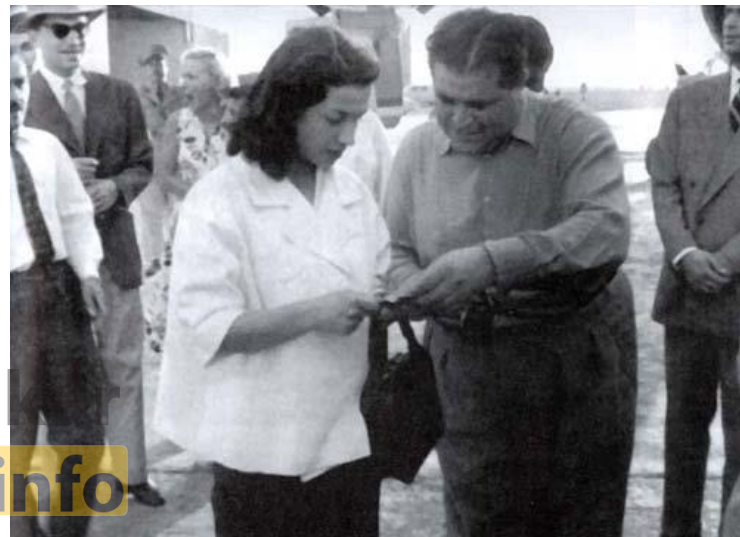
اخراج اشرف از کشور توسط دکتر مصدق

آنان حاضر بودند برای شکست نهضت به هرگونه همکاری با دولت انگلستان تن دهند. به همین سبب پس از قیام ۳۰ تیر، مصدق، اشرف پهلوی و مادرش را از ایران اخراج کرد.