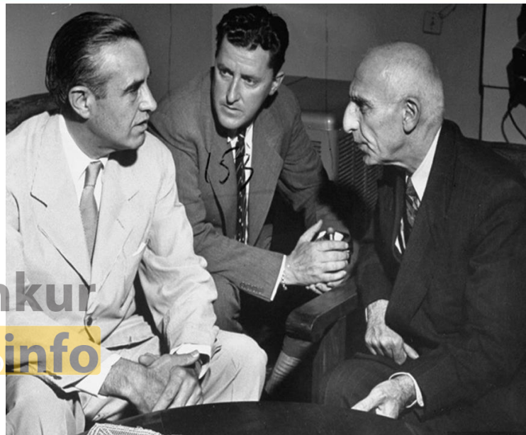
گفتگو دکتر مصدق با آریل هریمان

پس از مدتی آمریکا تصمیم گرفت میان ایران و انگلستان در موضوع نفت میانجی‌گری کند، چرا که حفظ ثبات بازار نفت را برای جلوگیری از بحران اقتصادی ضروری می‌دانست. به همین دلیل آمریکا در ۲۴ تیر ۱۳۳۰ آریل هریمان را به ایران فرستاد تا در قضیه نفت بین ایران و انگلیس میانجی‌گری کند.