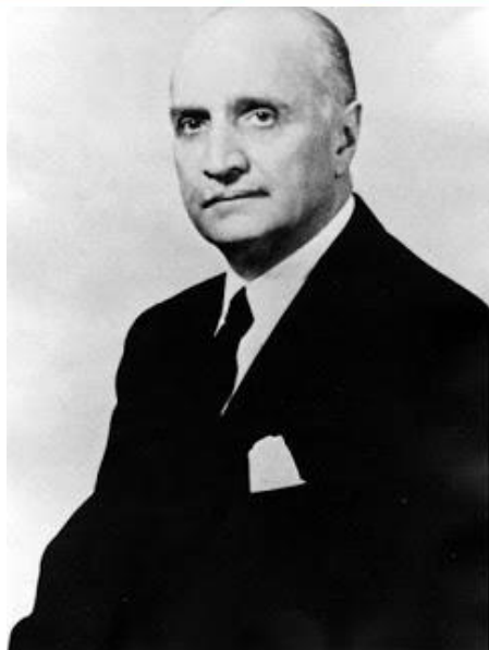
لوئی هِندرسون سفیر آمریکا