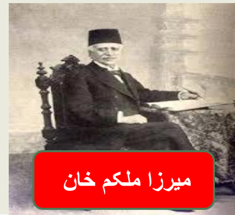
میرزا ملکم خان