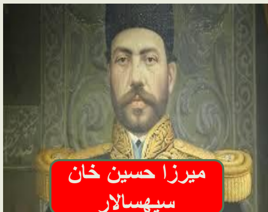
میرزا حسین خان سپهسالار