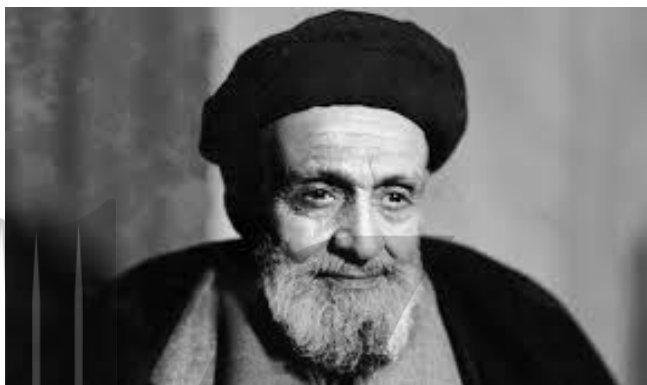
آیت الله کاشانی

عدم تصویب قرار داد الحاقی در مجلس باعث استعفا دولت منصور و نخست وزیری رزم آرا شد