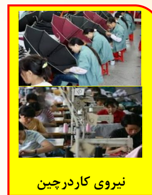
نیروی کار در چین

این عوامل باعث می شود تا تولید یک محصول در کشوری به صرفه باشد و در کشور دیگر، صرفه اقتصادی نداشته باشد و همین اختلاف، پایه بده - بستان دو کشور یا صادرات و واردات را تشکیل می دهد.