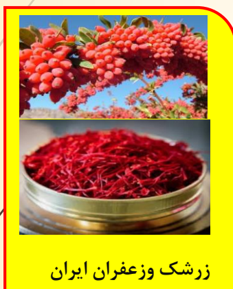
زرشک و زعفران ایران

دلایل شکل گیری تجارت و مبادله بین کشورها