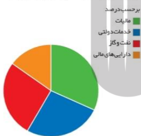
برآورد منبع درآمدهای عمده دولت ایران در سال ۱۳۹۷

الف) غیر از مالیات بخش زیادی از درآمدهای مورد نیاز دولت در ایران از محل فروش دارایی‌های مثل نفت تأمین می‌شود. این نمودار نشان می‌دهد که بخش زیادی از درآمدهای دولت از محل فروش دارایی‌های تجدیدناپذیری مانند نفت و گاز تأمین شده است که درآمدی پایدار نیست؛ با قیمت نفت نوسان می‌کند و قابل تحریم است فروش این نوع دارایی‌ها، عملاً فروش دارایی‌هایی است که نه فقط به ما بلکه به نسل‌های بعد هم تعلق دارد. اگر با درآمد حاصل از فروش این منابع، دارایی‌های دیگری خلق نشود و این درآمدها صرف هزینه‌های جاری کشور (نظیر پرداخت دستمزد و...) شود، در این صورت حتماً نسل‌های بعد، ما را نخواهند بخشید!