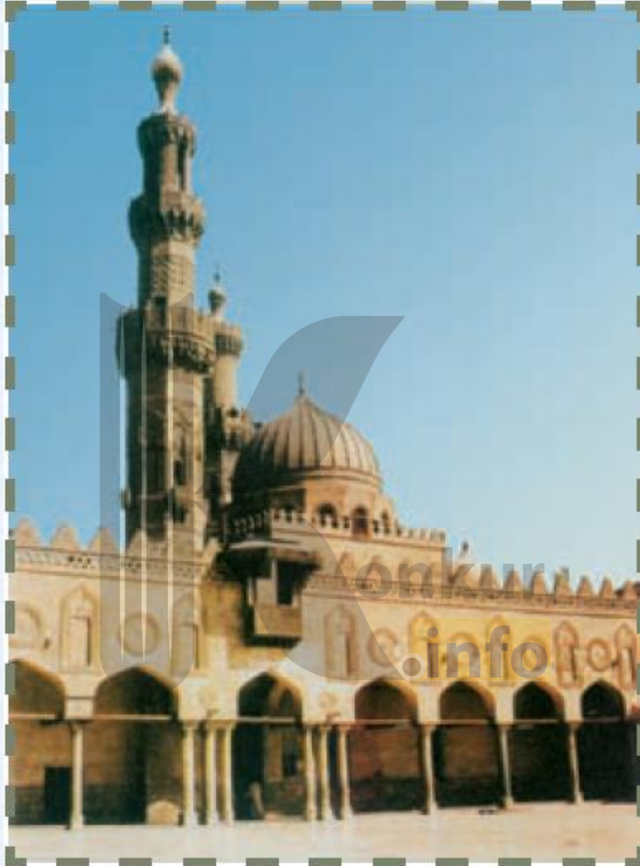
مسجد الازهر قاهره