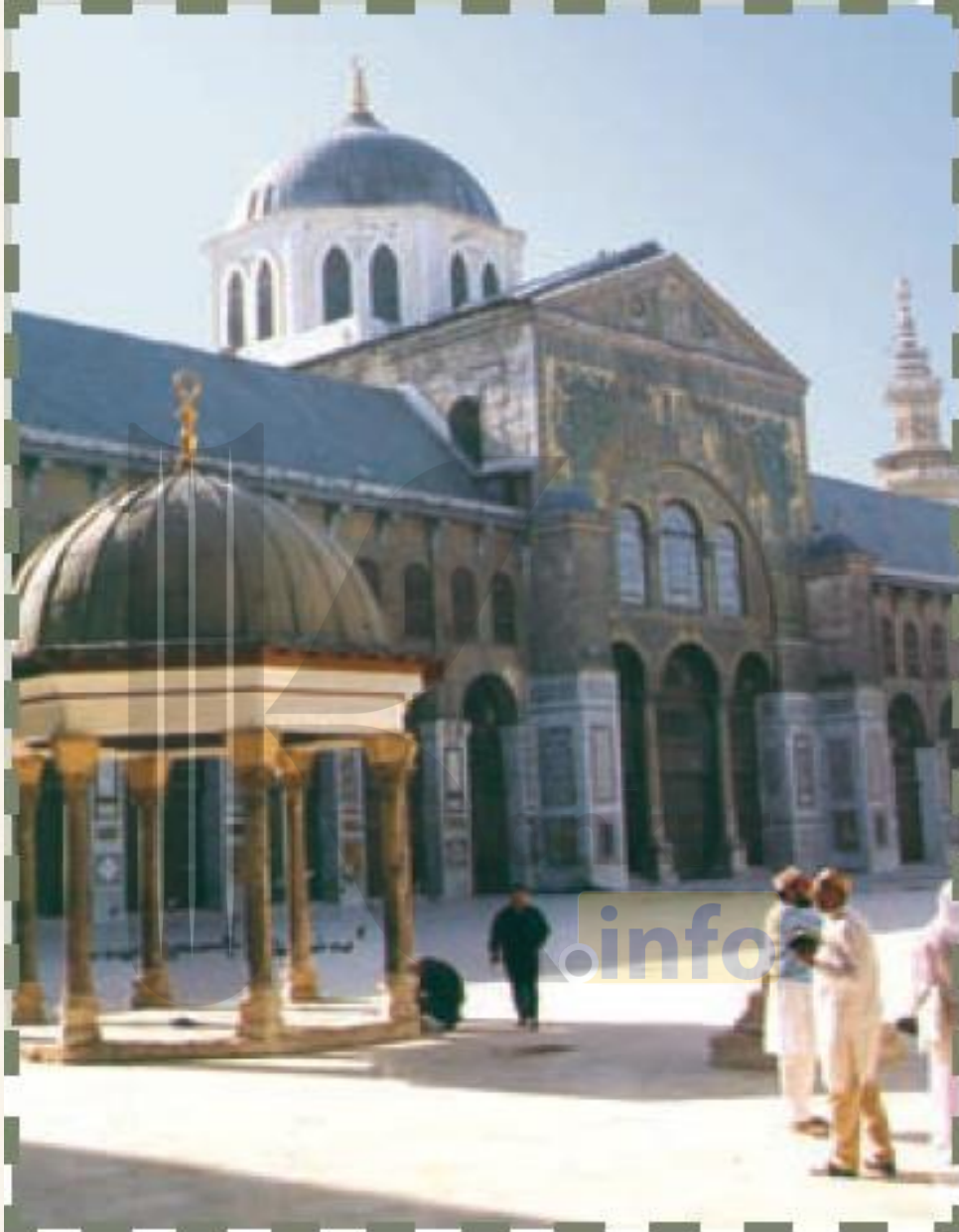
مسجد اموی — دمشق