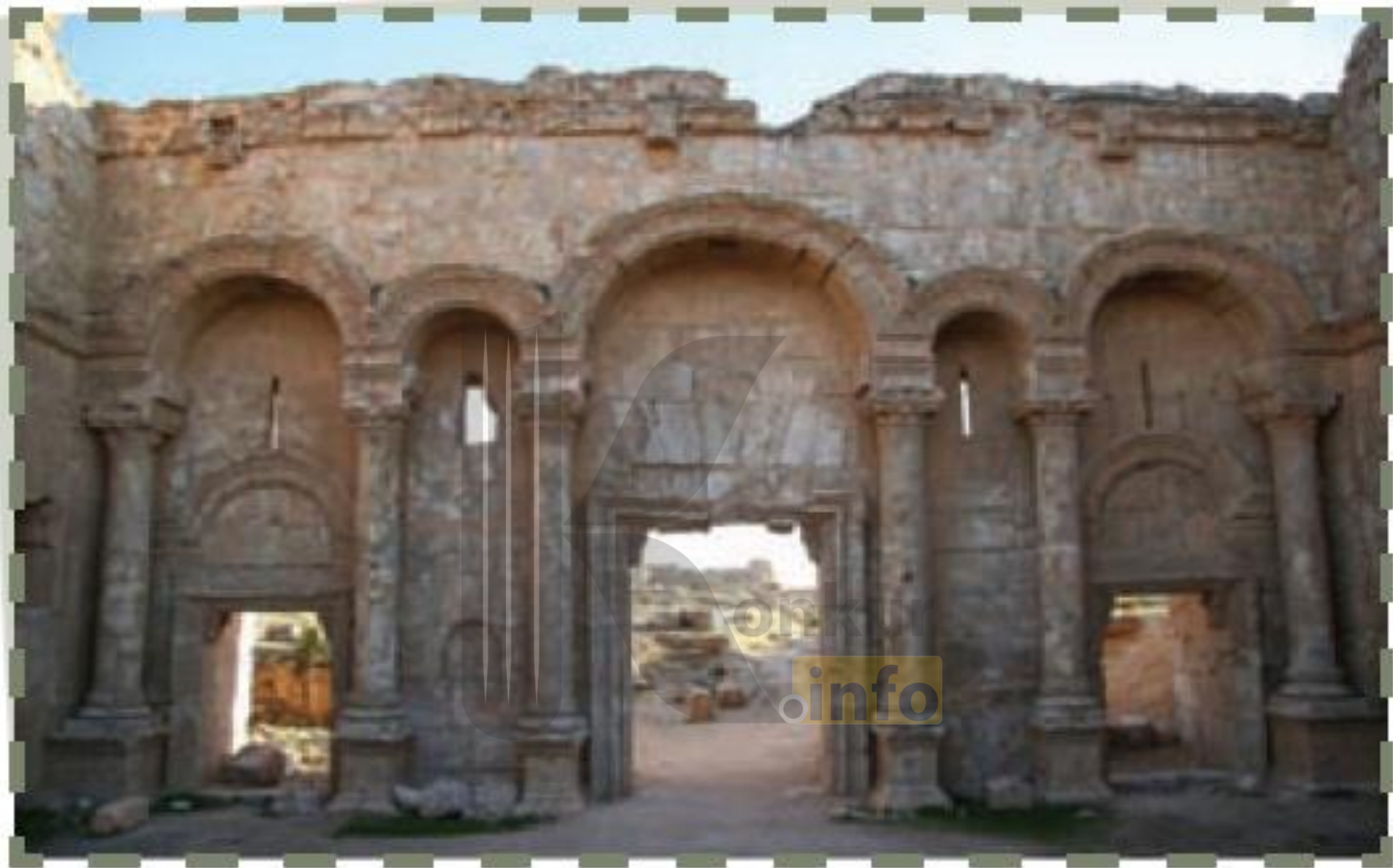
دروازه کاخ هشام بن عبدالملک در شهر رقه بر ساحل فرات