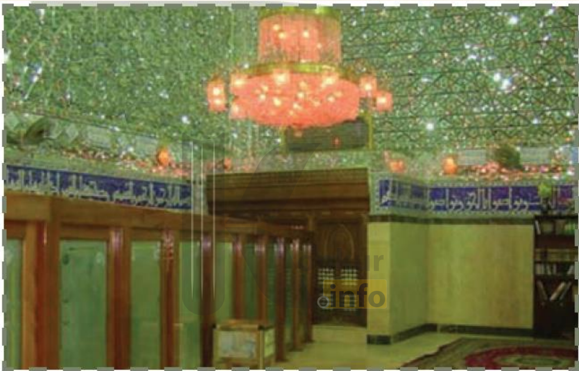
آرامگاه مختار در کوفه