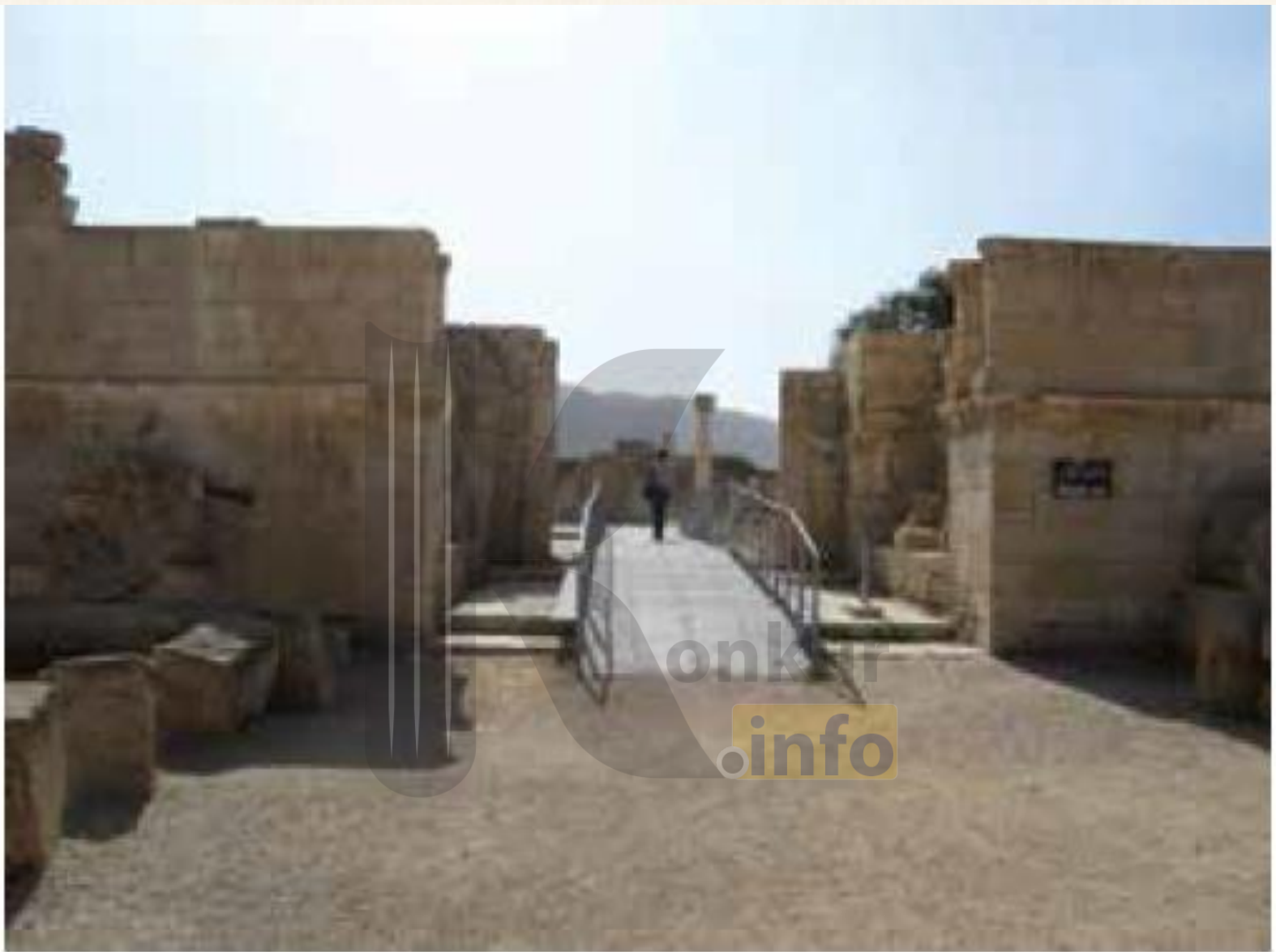
بقایای کاخ هشام بن عبدالملک در اریحا واقع در فلسطین اشغالی