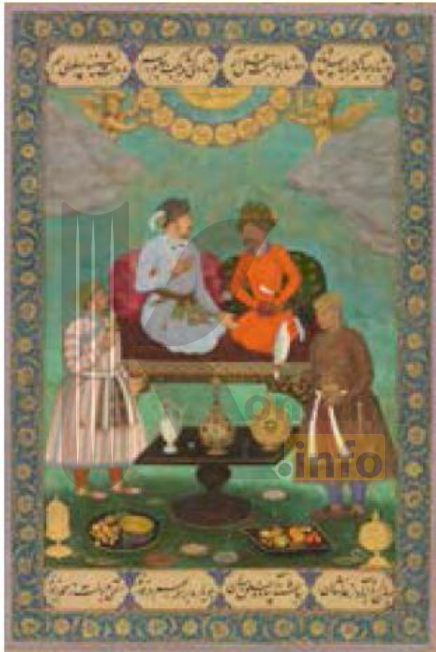
شاه عباس اول صفوی و جهانگیر بادشاه گورکانی هند https://konkur.info