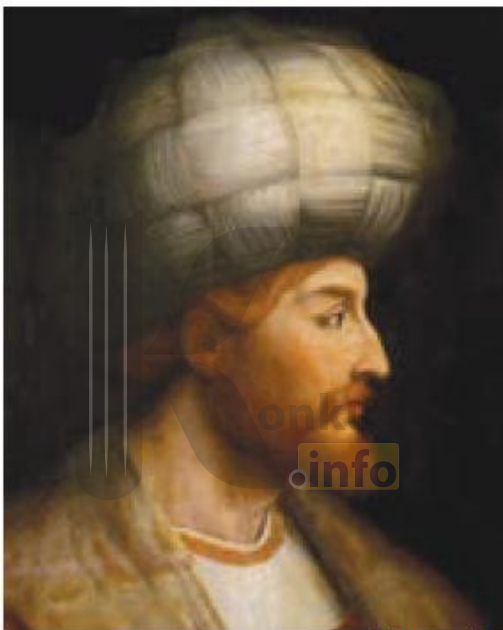
شاه اسماعیل اول