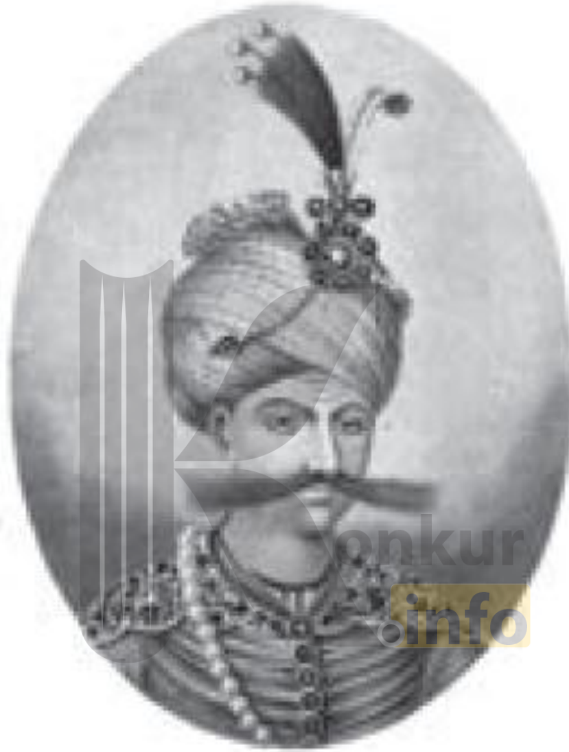
شاه عباس اول صفوی