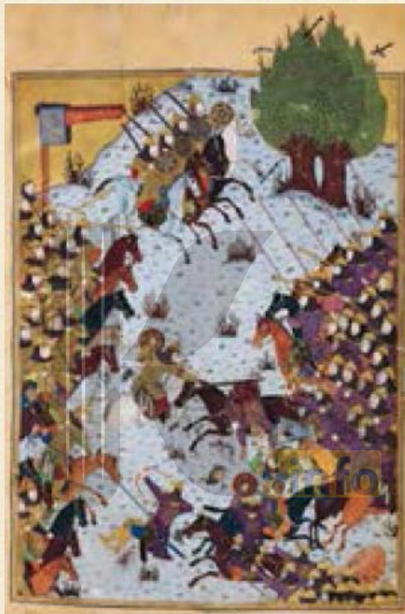
صفحه ای از نگاره های شاهنامه بایسنقری