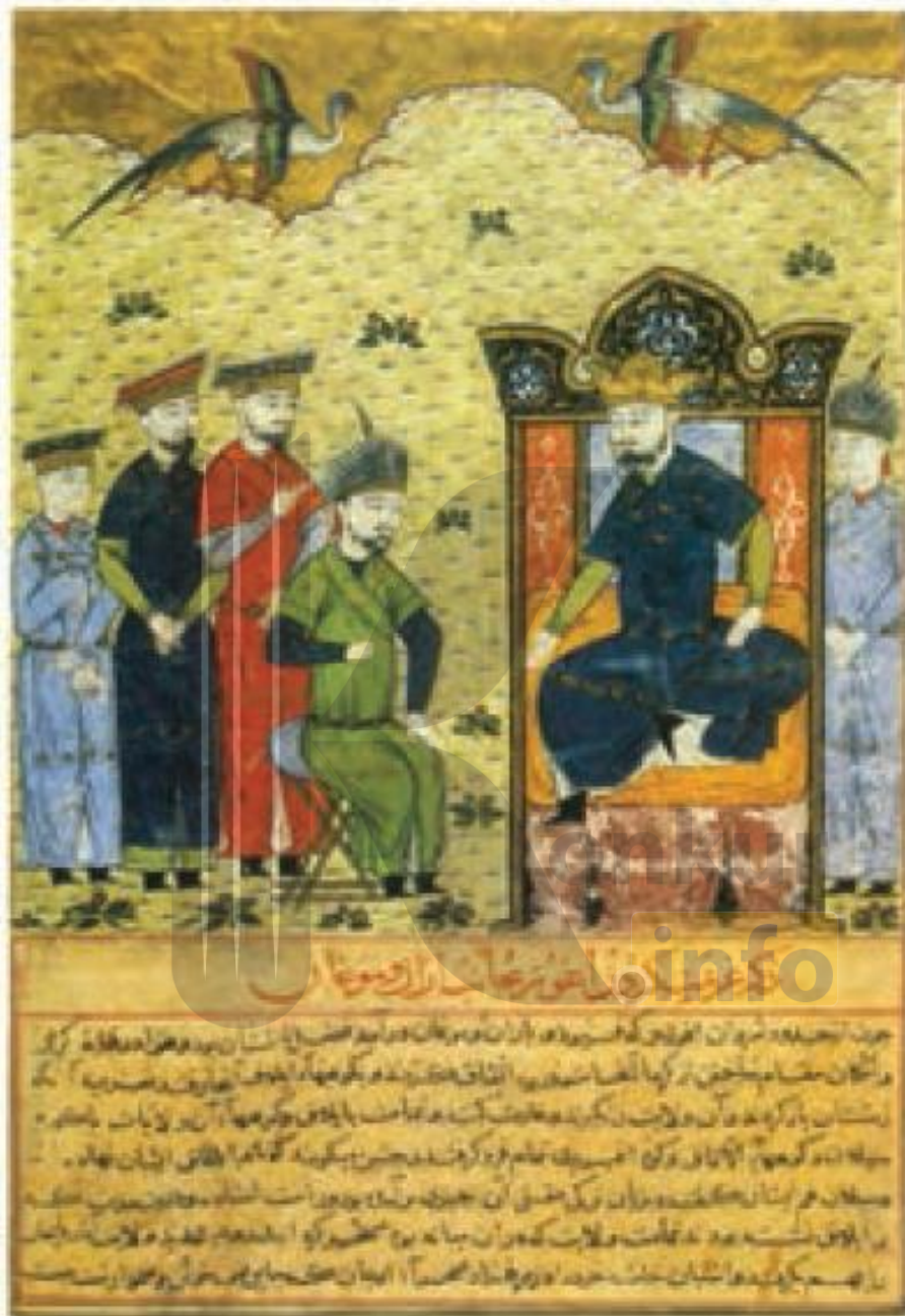
برگی از جامع التواریخ، نقاشی با آبرنگ و آب طلا