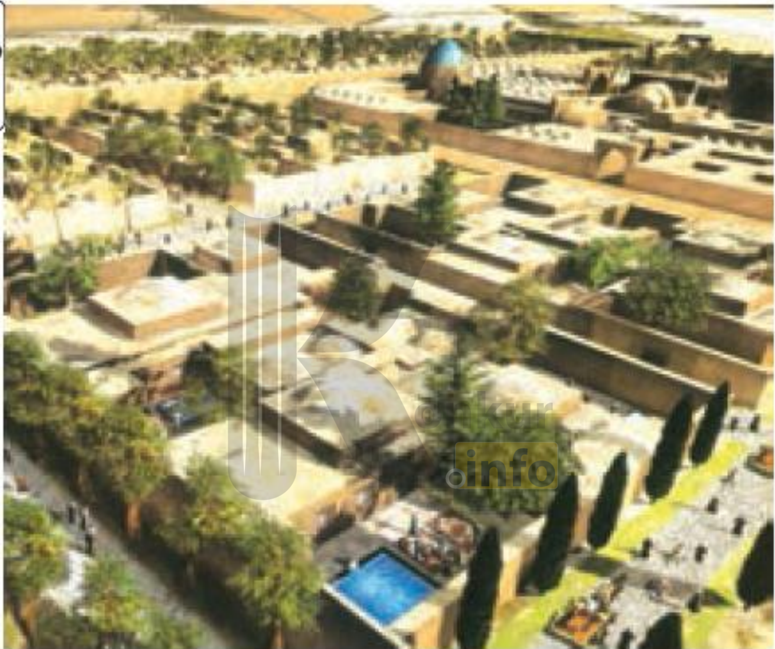
بازسازی گرافیکی مجموعه تاریخی شنب غازان