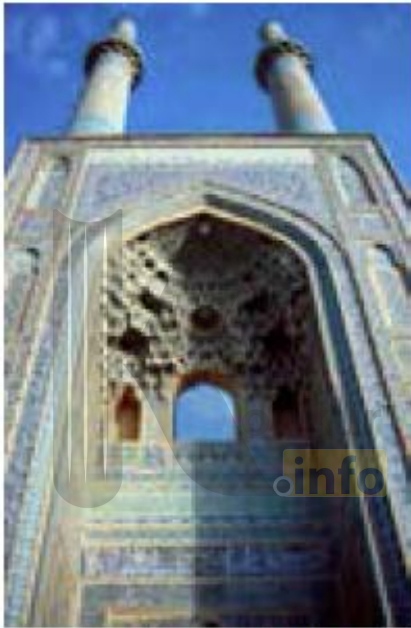
سردر و مناره‌های مسجد جامع یزد