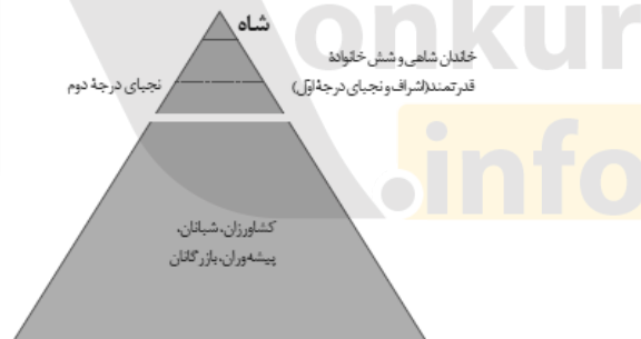
هرم اجتماعی ایران در زمان اشکانیان

جنگ‌های پیاپی اشکانیان با دشمنان خارجی موجب به‌وجود آمدن بسیاری از اسیران جنگی شده بود، این اسیران در فعالیت‌های کشاورزی، ساختمان‌سازی، معادن شاهی و خدمات خانگی کار می‌کردند.