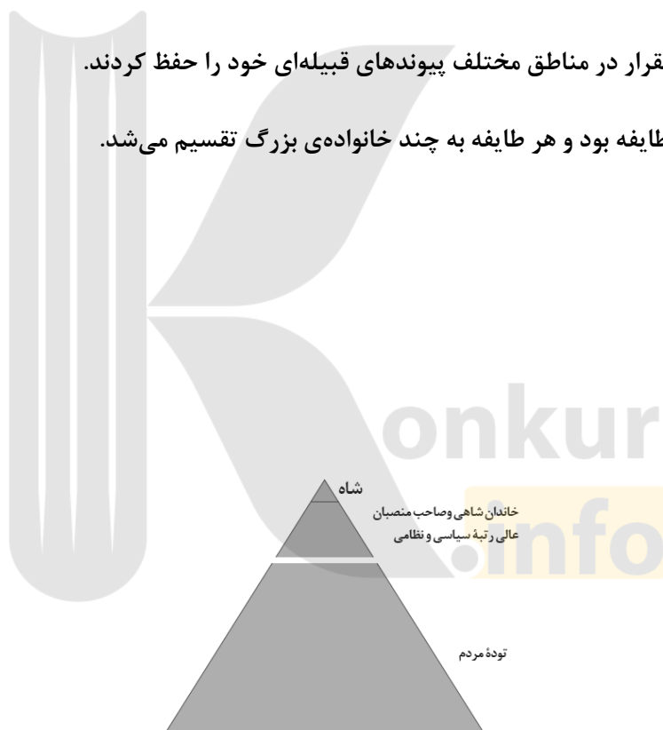
هرم اجتماعی دوران هخامنشی