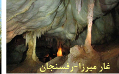
غار میرزا رفسنجان