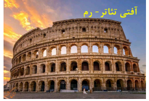
آفتی تئاتر - رم