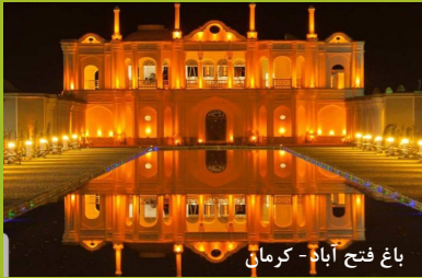
باغ فتح آباد - کرمان