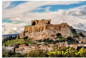
آتن - آکروپولیس