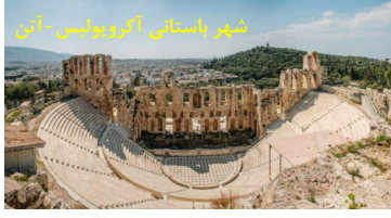
شهر باستانی آکروپولیس - آتن