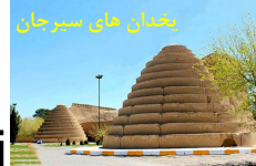
یخدان های سیرجان