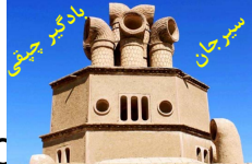
سیرجان یادگیر چینی