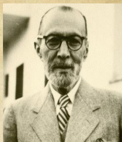
سید اشرف الدین گیلانی