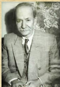
ملك الشعراى بهار