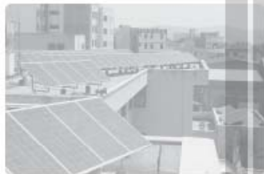
استفاده از صفحه‌های خورشیدی - اداره برق سمنان

از یک سو، انسان‌ها با پیشرفت در تولید ابزار و فناوری و دانش بر محیط طبیعی غلبه می‌کنند و آن را تحت اختیار خود درمی‌آورند؛ از سوی دیگر، ویژگی‌های هر ناحیه طبیعی همواره زندگی مردم ساکن در آن را تحت تأثیر قرار می‌دهد.